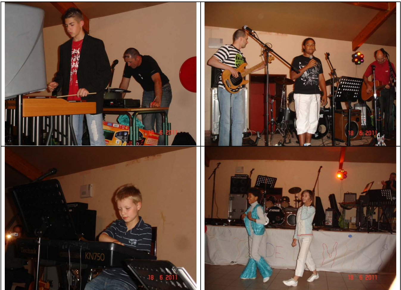
Un échantillon de nos jeunes talents,

C'est donc dans la salle Maurice RAISIN que les décibels ont pu résonner avec une organisation sans faille ponctuée par le passage de futurs musiciens, de chanteurs et de danseurs tous issus de nos villages.