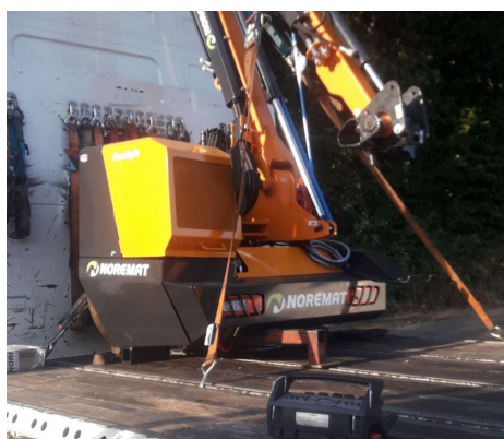
Livraison de l'épareuse 08/09/2021 Installation du rotor 14/09/2021