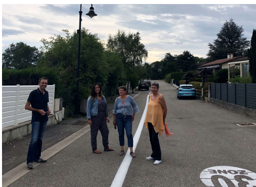
Réunion de rectification des tracés piétons Entreprise - Elus 14/09/2021