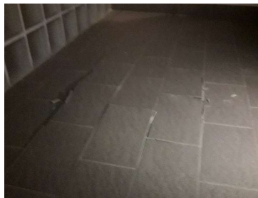
Le carrelage de la maison Jonas qui se soulève