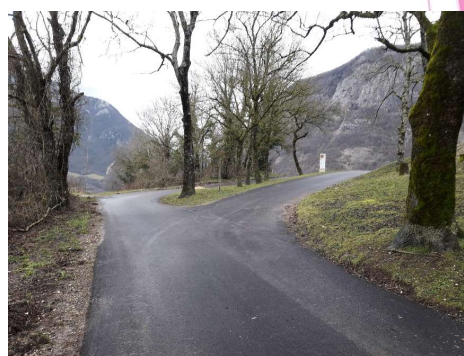
Aire de retournement 3 février 2021 Avec subvention du Département