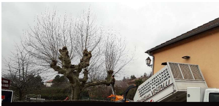
Tailles des arbres à Grésin

Pour les chemins ruraux, en matière d'élagage, l'article D. 161-24 du Code rural et de la pêche maritime prévoit que : « Les branches et racines qui avancent sur l'emprise des chemins ruraux doivent être coupées, à la diligence des propriétaires ou exploitants, dans des conditions qui sauvegardent la sûreté et la commodité du passage ainsi que la conservation du chemin. (...). Dans le cas où les propriétaires riverains négligeraient de se conformer à ces prescriptions, les travaux d'élagage peuvent être effectués d'office par la commune, à leurs frais , après une mise en demeure restée sans résultat (article D161-24 du code rural et de la pêche maritime)