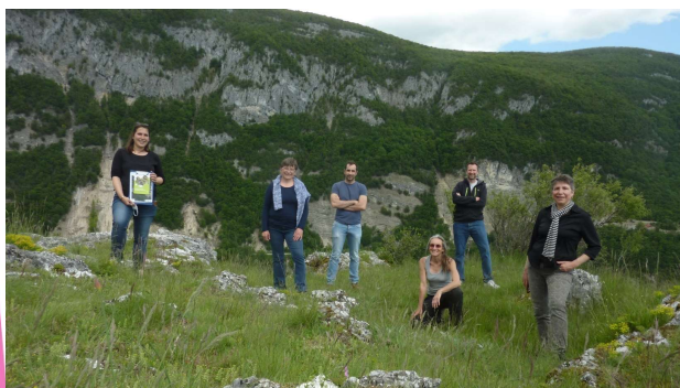
Visite du 26/05/2021 sur la prairie sèche du site « Des Roches » avec la CAPG - le Conservatoire des Espaces Naturels- les Elus de Léaz