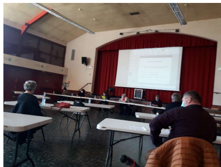
Réunion d'information avec le Conseil Départemental de l'Ain pour les Maires du Canton de Thoiry 12/03/2021