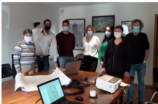
Groupe de travail fibre optique 11/01/2021 SIEA - BOUYGUES - ELUS