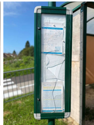
Le panneau indiquant les horaires du bus cassé