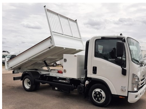
Livraison du nouveau camion technique début octobre (Photo indicative)