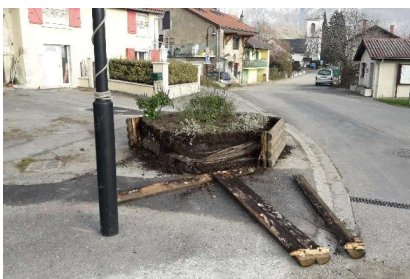
Un bac à fleur détruit par un véhicule